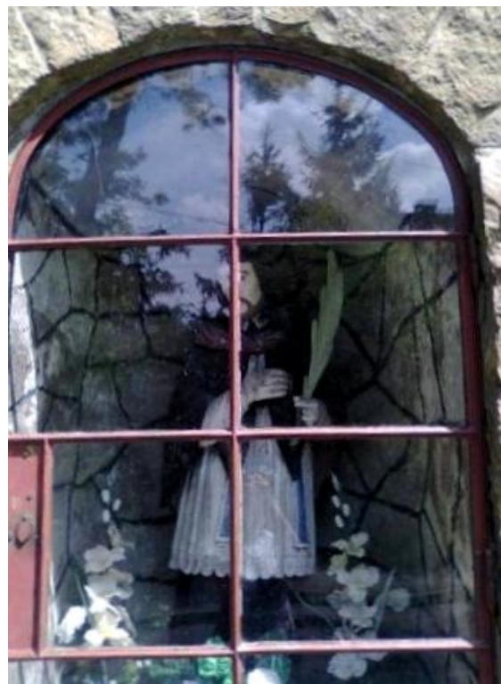
Kozy k. Bielska-Białej ul. Beskidzka