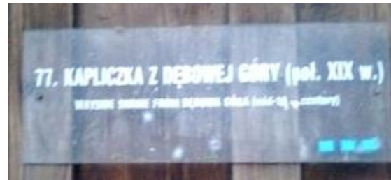
Chorzów – skansen