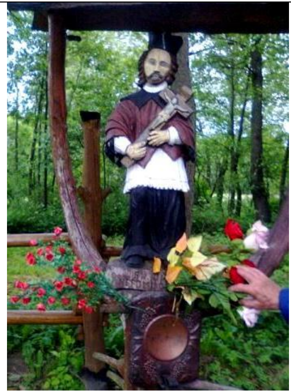
Skalbania (gm. Łazy) pow. Zawiercie